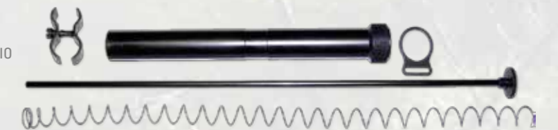
KIT PROLUNGA SERBATOIO Cal. 12 - 10 COLPI MAGAZINE EXTENSION KIT 10 SHOTS