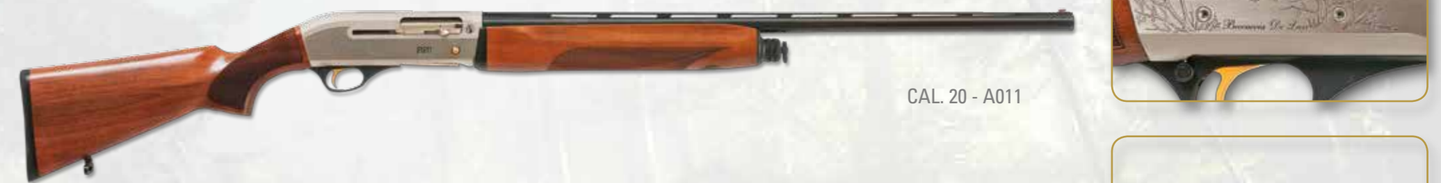
CAL. 20 - A011