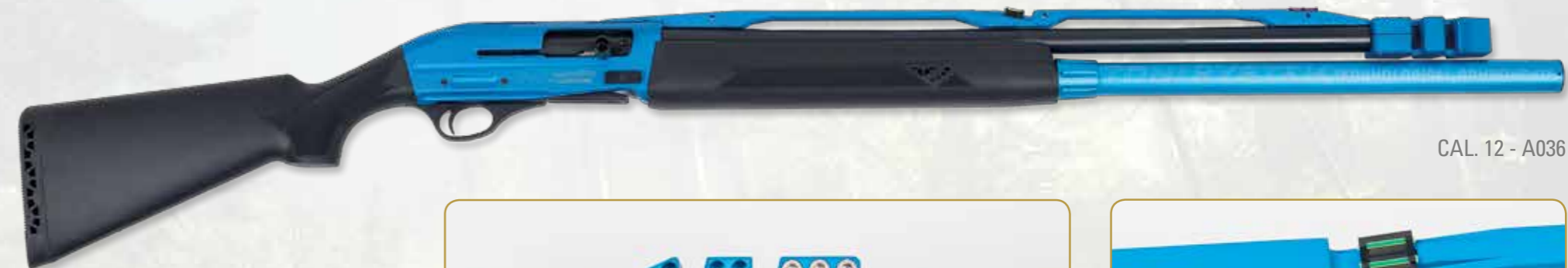
CAL. 12 - A036