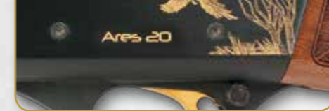
CAL. 20 - A029SX