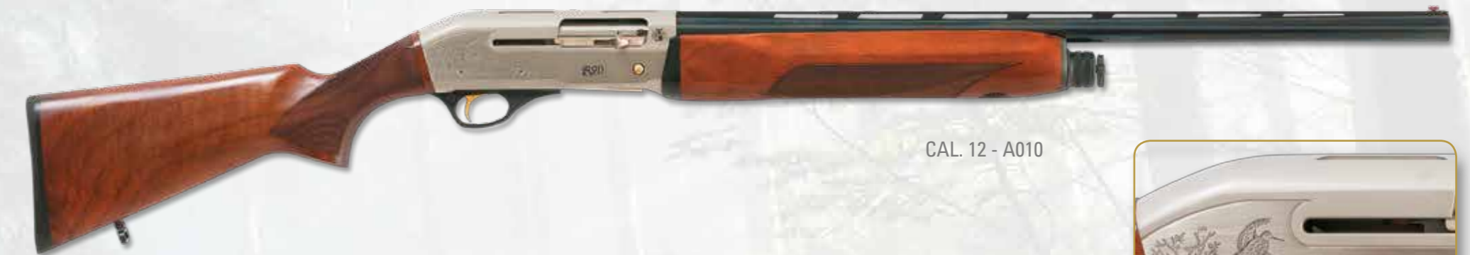
CAL. 12 - A010

"Range Top" model with sides engravings where is written in, on right side, trademark, logo, model, gauge and hunting scene with woodcock in flight; on the left side Made in Italy and hunting scene with woodcocks in flight. Produced in gauge 12, 20, 28. Stock and forend are in selected walnut, oil finishing and knurls by an original and functional design, in the forend is engraved the IRON ARMI logo. Produced in NIKEL BLACK version where the treated ruthenium receiver with fine sandblasting and shiny polished sides on which are written in, logo and drawing in black.