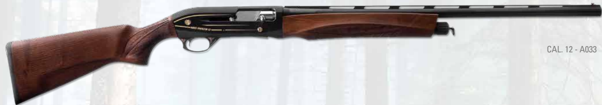
CAL. 12 - A033

Basic model. Inertial functioning. Black anodized receiver, mat finished on the tops and shiny polished sides. Geometrical engraving. Right side: logo, model and gauge in gold; left side: trademark and Made in Italy in gold. Produced in 12x76 ch gauge. Deep drilled barrel in 42cr-mo4 steel. Walnut stock, oil finished and knurls by a modern and ergonomic design. In the forend is engraved the Iron Armi logo.