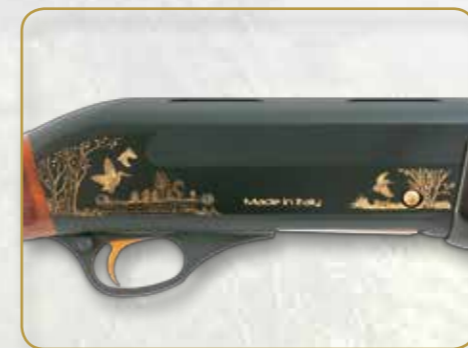
CAL. 28 - A030SX