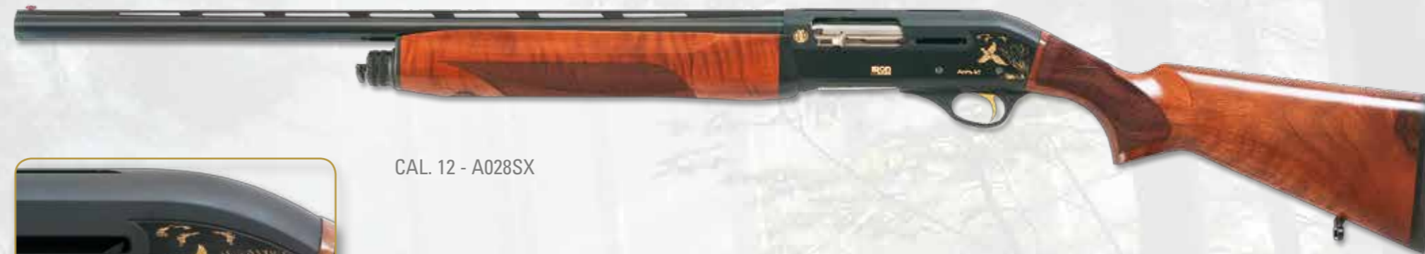
CAL. 12 - A028SX

Gemello dell'ARES ma con espulsione a sinistra. Ares twin but with left expulsion.