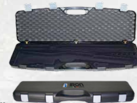
VALIGETTA RIGIDA RIGID CASE