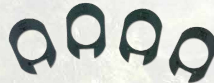
SET REGOLAZIONE PIEGA CALCIO STOCK ADJUSTMENT FOLDING SET