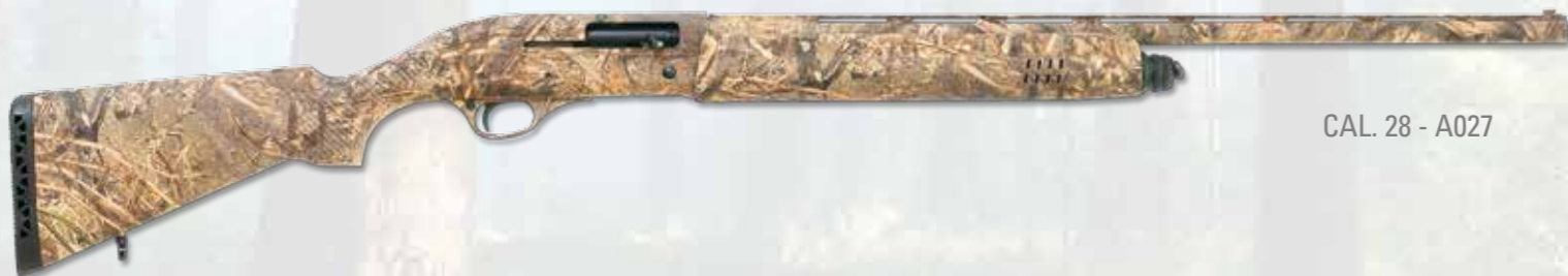
CAL. 28 - A027