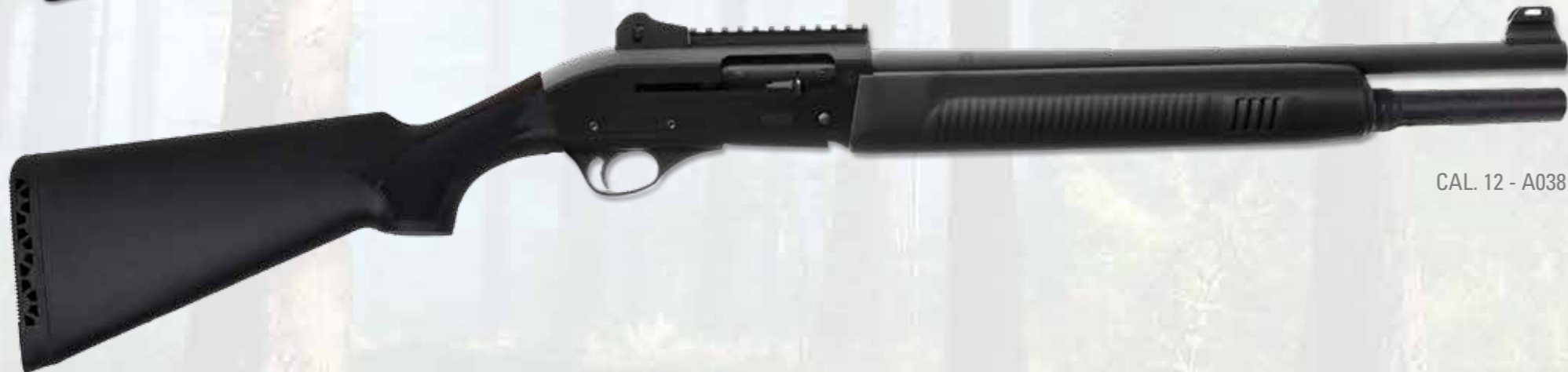
CAL. 12 - A038