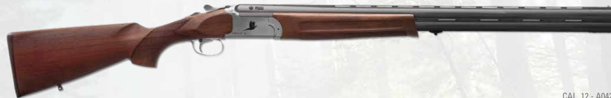
CAL. 12 - A042

Over/Under model in 12x76 ch gauge. Steel receiver just treathed to have strong resistance and the traditional "OLD SILVER" finish. Both sides are engraved with model, gauge and animal in black. The bottom is engraved with logo and Made in Italy also in black. Deep drilled barrel in 42 cr-mo4 steel, inside chromed and external blued, 5 mobile chocke tubes are available. Walnut stock oil finished. Ergonomic shape of the forend with nice and helpful grip.