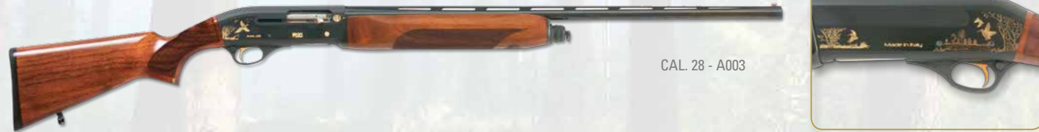
CAL. 28 - A003