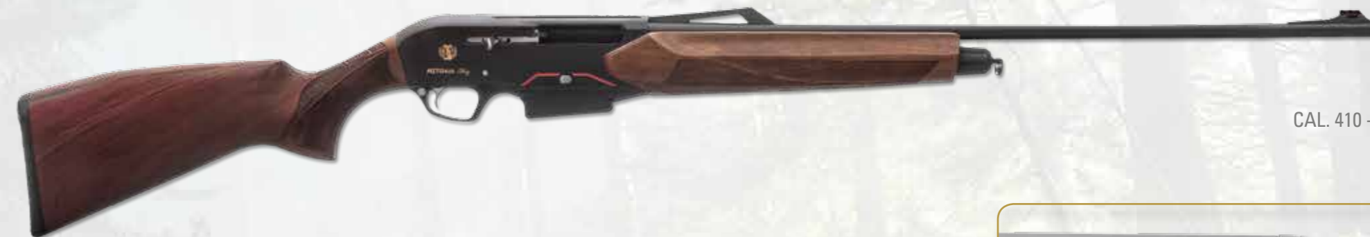
CAL. 410 - A032

Gas operating system semiauto in 410 gauge. Two rounds (plus one) box magazine capacity. This model is specially configured for wild boar-hunting and shot activity. Black anodized receiver mat finished on the tops and shiny polished sides. Right side engraved with model, logo and gauge in silver; left side with trademark, Made in Italy and hunting boar scene in silver. On both side a geometric small design in orange. On the top of receiver it is possible to fit some accessories or red points etc. Deep drilled barrel in 42 cr-mo4 steel, smooove cilindric bore. Walnut stock oil finished. The shape is in accordance with the style of the gun and the ceckering is modern and ergonomic. In the forend there is engraved the Iron Armi logo.