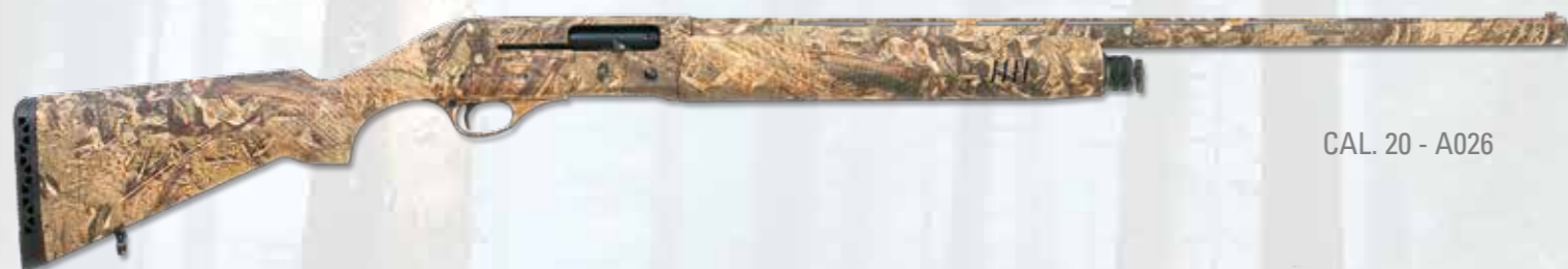
CAL. 20 - A026