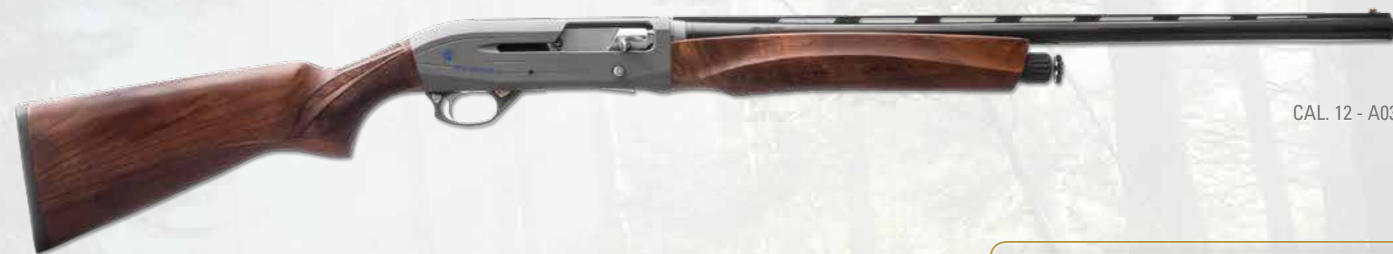
CAL. 12 - A034

Tecno model. Inertial functioning. The receiver, mat finished, is protected with modern nano-technologies (ceramic vernices), grey stone colour. This protection increase a lot the corrosion resistance. Geometrical engraving, right side: logo, model and gauge in blue; left side: trademark and Made in Italy in blue. Produced in 12x76 ch gauge. Deep drilled barrel in 42cr-mo4 steel. Walnut stock, oil finished and knurls by a modern and ergonomic design. In the forend there is engraved the Iron Armi logo.