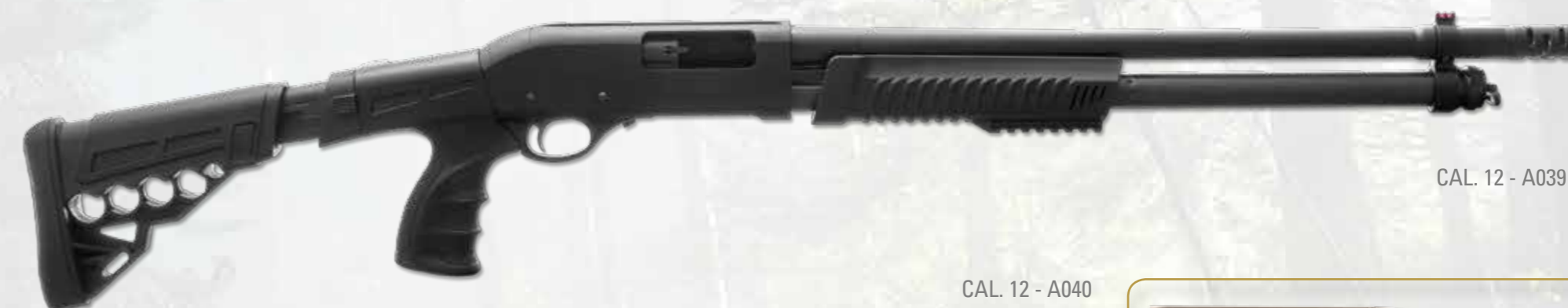
CAL. 12 - A039

Pump action shotgun in 12x76 ch gauge. This gun has been proper studied for Defence, Tactical shooting and Law Enforcement uses, because a manual operating gun, perfectly shoots EVERY KIND of ammunitions (in 12x70/76 ch) independently of their power. It means LETHAL-LESS LETHAL and NOT LETHAL purpose cartridges. Tube magazine 7 rounds (plus one) capacity. (It is possible to have a fixed reduction capacity at two rounds). The receiver in strong aluminium league (ergal 55) is mat finished and black anodized. On request, it is possible to get the receiver and barrel coated with moderns nanoceramic technologies (ceramic vernices). On the top of the receiver it is possible to fit a Piccatinny rail in order to fit Ghost rings, lasers, red points and other accessories. Deep drilled barrel in 42 cr-mo4 steel, chromed inside and external blued. It is possible to fit at the muzzle some accessories like Muzzle brake and some others. The stock is in tecnopolimer and can be Telescopic and/or folding. Tecnopolimer forend too with an ergonomic design and piccatinny rail incorporated.