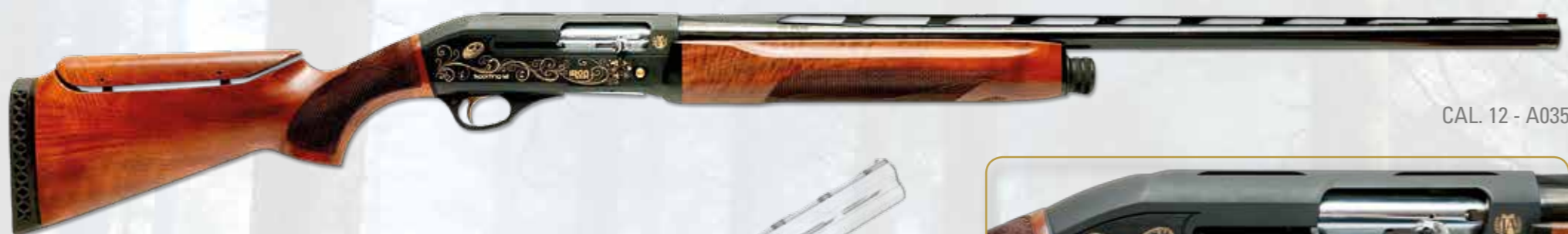
CAL. 12 - A035

"Sporting" model created for Compak, Sporting and skeet shooting course. Equipped with mm 760 barrel with 10-rib, adjustable stock, whit sides engravings where is written in, on right side, trademark, logo, model and gold decoration; on the left side Made in Italy and gold decoration. Produced in gauge 12. Stock and forend are in selected walnut, oil finishing and knurls by an original and functional design, in the forend is engraved the IRON ARMI logo.