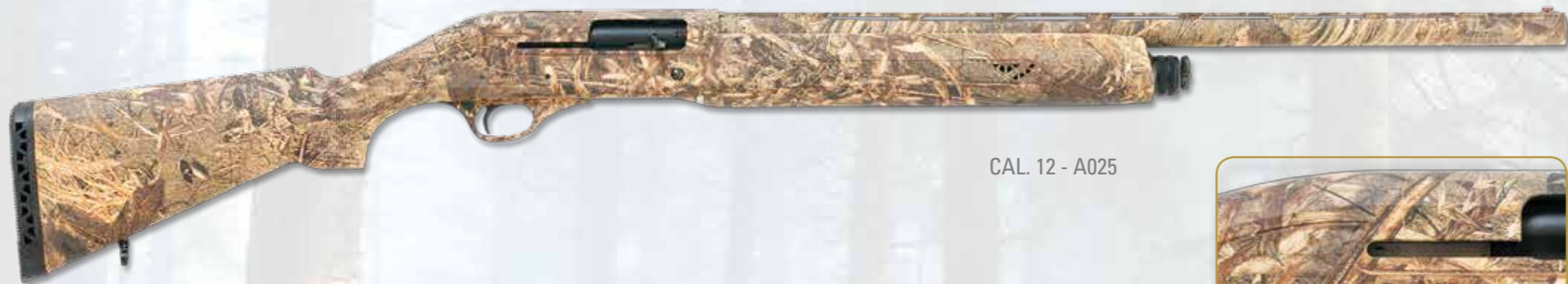
CAL. 12 - A025

Camouflage model for ambush hunting, where hunter ad shotgun have to be integrated with the surrounding nature. With sides engravings where is written in, on right side, trademark, logo, model; on the left side Made in Italy. Produced in gauge 12, 20, 28. Produced in DUCK BLIND version where all visible parts are covered by colors that recalls the undergrowth colors.