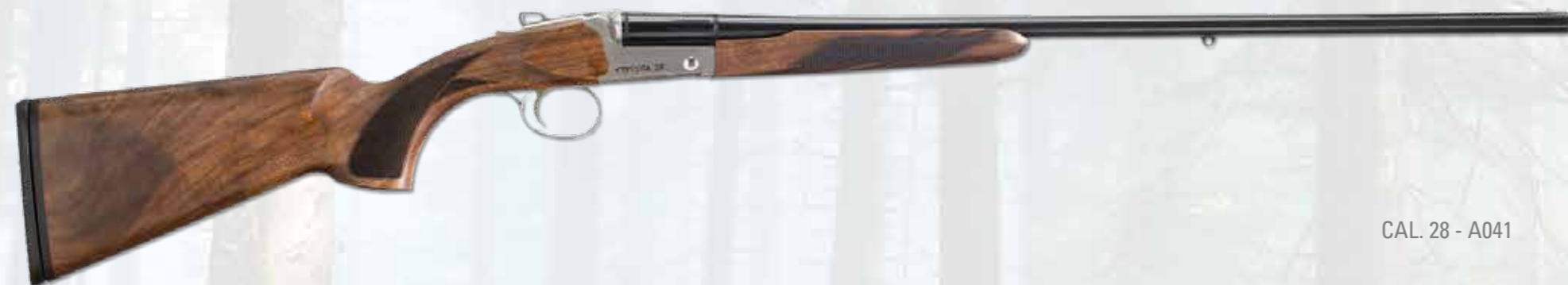
CAL. 28 - A041

Side/by side model in 28 gauge. Steel receiver just proportioned to have a light, balanced and elegant design. This model has been studied for a classic and sportive hunting. Receiver "OLD SILVER" finished is engraved on both sides with name and gauge in black. The bottom is engraved with the logo and Made in Italy in black. Deep drilled barrel in 42 cr-mo4 steel, inside chromed and external blued. 5 mobile choke tubes are available. Classic shape of walnut stocks and beavertail forend, oil finished. Nice checkering design for a good grip too.