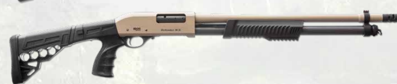
CAL. 12 - A040