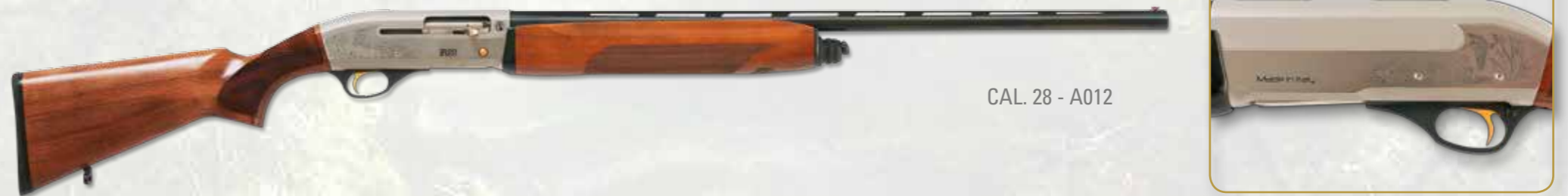
CAL. 28 - A012