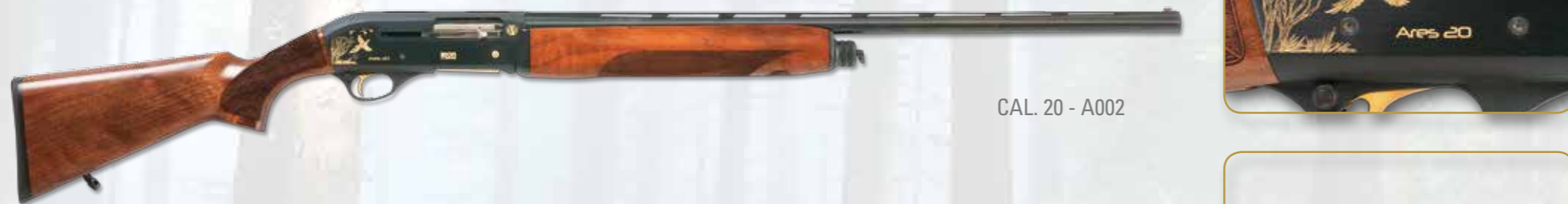
CAL. 20 - A002