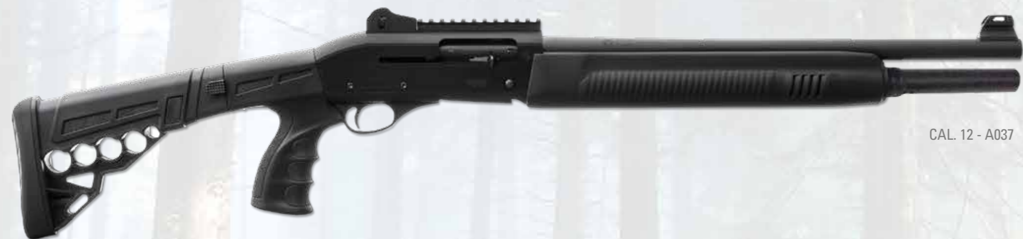
CAL. 12 - A037

Ares Defender 12/76 semi-automatic gas-operated refilling system, it was born as a defense rifle, but it is also suitable for dynamic shooting. It has a gritty outfit, it's beautiful handy and functional when used. Created and already used abroad by foreign armies and police, it can be placed with dignity in the sports field of dynamic shooting. Produced in 12/76 gauge synthetic version with adjustable or folding polymer stock, polymer forend with mm 470 or mm 510 slug barrel. Magazine tube with a capacity up to 7 shot plus one in the barrel. Sighting system for backsight, adjustable diopter in sights and drift. It is equipped with a weaver slide above the receiver for use with accessories. It is exceptional in the rapidity of charging. Certified by Banco Nazionale di Gardone Valtrompia for use with steel ammunition.