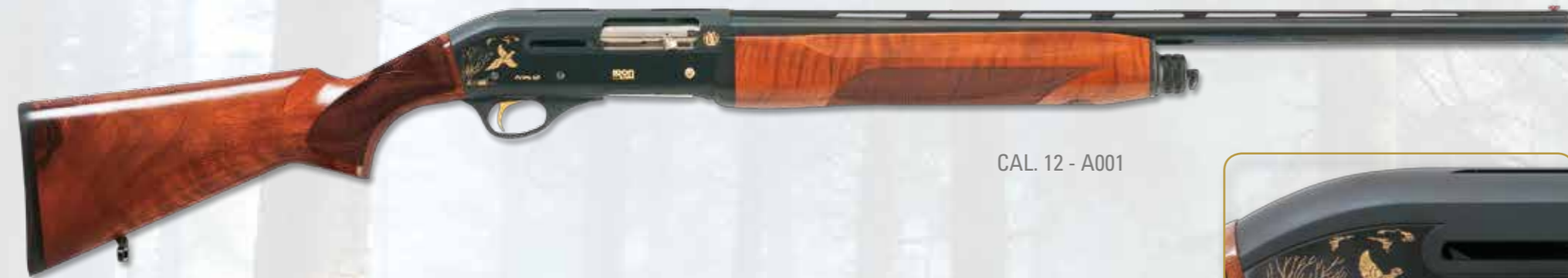
CAL. 12 - A001

Basic model with sides engravings where is written in, on right side, trademark, logo, model, gauge and hunting scene with pheasant in flight; on the left side Made in Italy and hunting scene with woodcocks in flight. Produced in gauge 12, 20, 28. Stock and forend are in walnut choice, oil finishing and knurls by an original and functional design, in the forend is engraved the IRON ARMI logo. Produced in BLACK GOLD version where the black anodized receiver with fine sandblasting and shiny polished sides on which are written in, logo and drawing in gold.