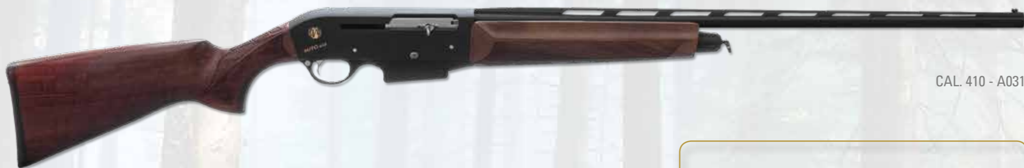
CAL. 410 - A031

Gas operating system semi-auto in 410 gauge. Two rounds (plus one) box magazine capacity. It will function indifferently with 36 gauge and 410 cartridges. Black anodized receiver, mat finished on the tops and shiny polished sides. Right side engraved with model, logo and gauge in gold; left side with trademark and Made in Italy in gold. Deep drilled barrel 42cr-mo4 steel. Interchangeable chokes. Walnut stocks, oil finished and knurls by a modern and ergonomic design. In the forend there is engraved the Iron Armi logo.