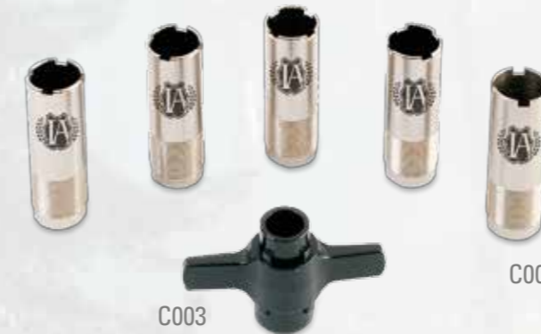
SERIE 5 STROZZATORI CON CHIAVE N. 5 MOBILE CHOKES WITH KEY