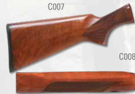
CALCIO E ASTA In legno pregiato STOCK AND FOREND in hardwood